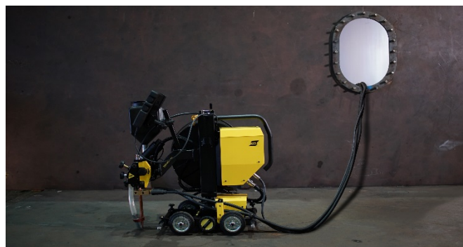
Modułowa konstrukcja sprawdza się w trudno dostępnych miejscach