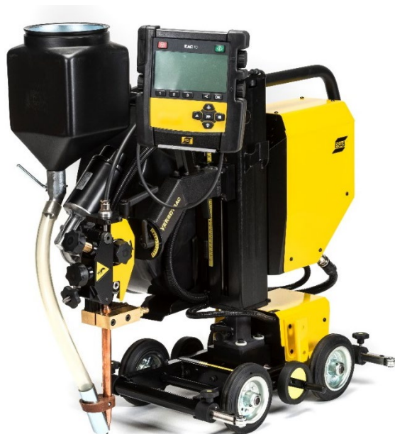
Czterokołowa wersja traktora Versotrac do spawania SAW