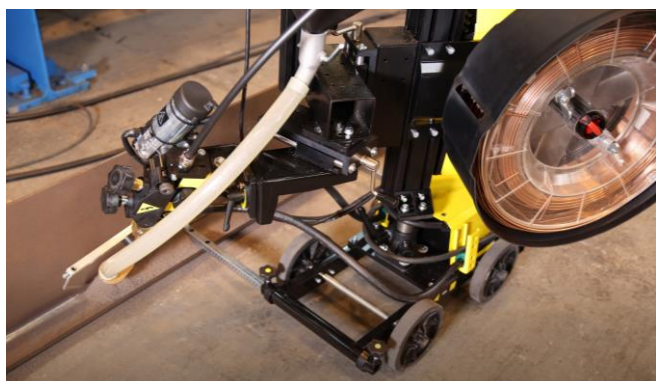
Versotrak Cadet to idealny traktor do spoin pachwinowych.

Więcej informacji znajdziesz na esab.com .