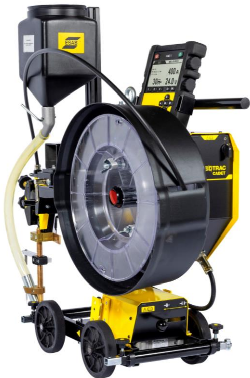
Versotrak Cadet — pojedynczy drut